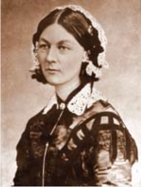
Florence Nightingale From/De : Carte de Visite Date: circa 1850s

Everyone has heard of Florence Nightingale , “the founder of modern nursing”. A sickly child born into a well-to-do family, she early recognized the importance of good nursing care. Determined to devote her life to nursing, she studied in Germany, and on her return established a small hospital in London – something “ladies” simply did not do! She volunteered to serve in the Crimean War, and found that her first fight was with bureaucracy. Nonetheless, she transformed filthy, crowded, disorganized barracks into warm, comfortable, sanitary wards. And she saved thousands of lives. She was affectionately known as “The Lady of the Lamp” from her habit of making rounds at night. Florence Nightingale returned to England as a hero and established a friendship with Queen Victoria. To develop better nurse training, she raised funds to start the first School for Nurses – and donations poured in. She wrote – copiously – to everybody!